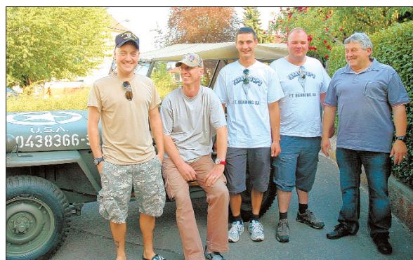
ABREISE Vor dem Aufbruch in die Normandie. PBG

Am Sonntag, 7. Juni, findet der erste Kirchentag der Reformierten der Bezirkssynode Solothurn statt. Das Fest beginnt mit einem Familiengottesdienst um 10 Uhr. Ab 11 Uhr gibt es Spiele im Freien, Mittagessen, Music-Surprise, Kaffee und Kuchen. Ab 9.30 Uhr fährt ein Shuttlebus die Besucher vom Bahnhof Grenchen Süd zur Zwinglikirche. (MGT)