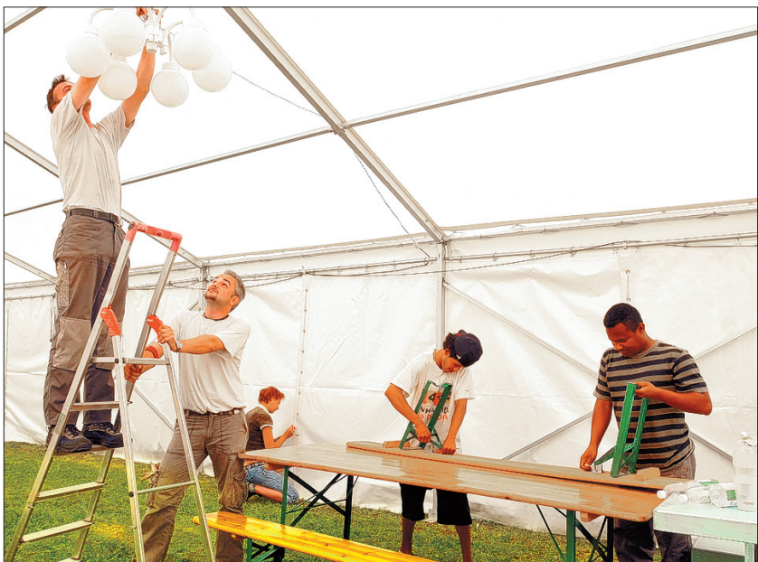
FLEISSIG Ein Team von Pro Work baut das Festzelt auf. MADDALENA TOMAZZOLI HUBER